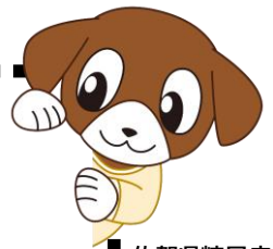
佐賀県糖尿病対策 キャラクター 「ナナ」ちゃん

肝がん予防、歯、口の健康、卒煙支援、メンタルヘルス等、希望に応じた健康教育を実施しています